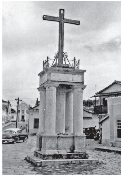
Figura 1 - Foto do monumento da Cruz do Anhanguera

O site informa que a foto foi tirada em 1957